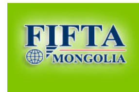
Foreign Investment and Foreign Trade Agency