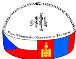
Česko-Mongolská obchodní komora